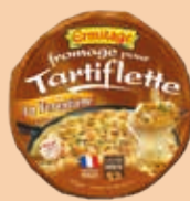
Tartiflette Forestière 450g