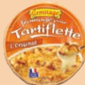
Tartiflette Originale 450 et 500g