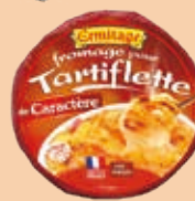
Tartiflette de Caractère 450g