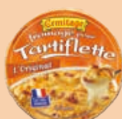
Tartiflette Originale 250g