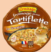
Tartiflette Forestière 450g 2 PTS