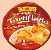
Tartiflette de Caractère 450g 2 PTS