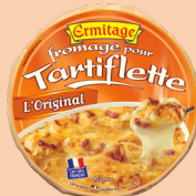
Tartiflette Originale 450 et 500g 2 PTS