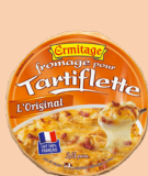
Tartiflette Originale 250g 2 PTS