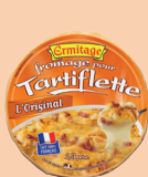
Tartiflette Originale 250g 2 PTS