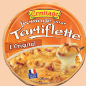
Tartiflette Originale 450 et 500g 2 PTS