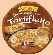
Tartiflette Forestière 450g 2 PTS