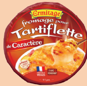
Tartiflette de Caractère 450g 2 PTS