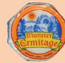
Munster 200g 2 PTS