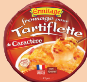
Tartiflette de Caractère 450g 2 PTS