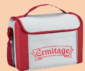
Lxlh : 27x14x20cm