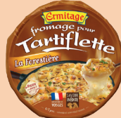
Tartiflette Forestière 450g 2 PTS