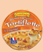
Tartiflette Originale 250g 2 PTS