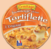
Tartiflette Originale 450 et 500g 2 PTS