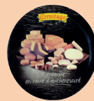
Diamètre : 30cm