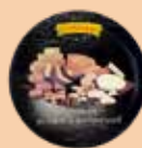
Diamètre : 30cm