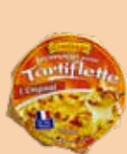
Tartiflette Originale 250g 2 PTS