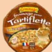
Tartiflette Forestière 450g 2 PTS