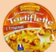
Tartiflette Originale 450 et 500g 2 PTS