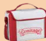
Lxlxh : 27x14x20cm