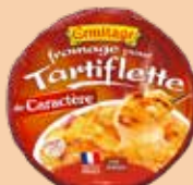
Tartiflette de Caractère 450g 2 PTS